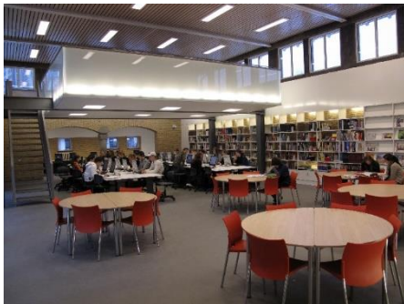
Benedengymzaal, nu Open Leercentrum

En de gymzaal ... is de gymzaal niet meer maar een hypermodern Open Leercentrum. Een plaatje, wellicht de meest geslaagde verbouwing van de gehele school.