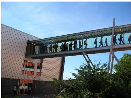
Loopbrug tussen gebouwen B en D

Via een loopbrug op de tweede verdieping is