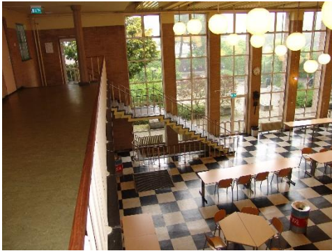
Hal Maaslandcollege 2020