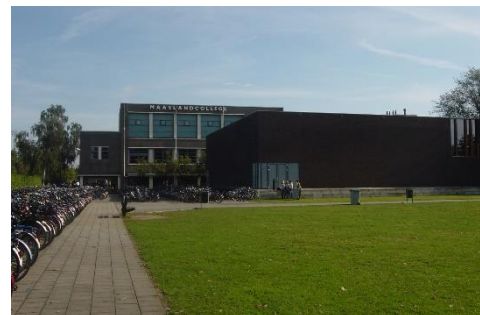
Zicht op Maaslandcollege: nieuwe gymzalen. "Gymnasion".

Gebouw C (het zogenaamde Gymnasion in de terminologie van voormalig conrector Jos Janssen) is onder andere te bereiken via een loopbrug op de eerste etage. Je komt dan in de nieuwe Nederlandse vleugel van de school. Grenzend aan twee mooie gymzalen. Een bijzonder fris gebouw, geheel in eigen stijl opgetrokken.