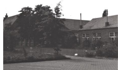
Achterzijde gebouw Oude Molenstraat 2