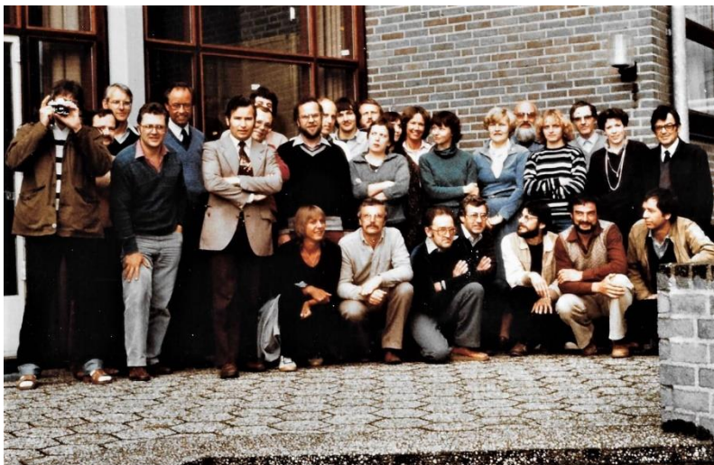
Lerarencorps De Pelgrim schooljaar 1981/1982

De Pelgrim was onderdeel van de Stichting R.K. scholen voor Ulo te Oss. In 1971 werd de school onderdeel van het grotere schoolbestuur van de Stichting Carmelcollege, waar voornamelijk scholen in het noorden en oosten aan verbonden waren.