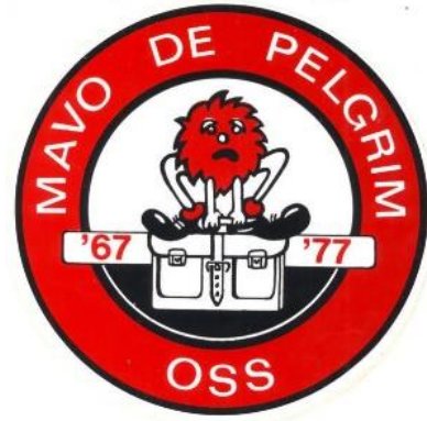
Sticker bij gelegenheid 10 jarig bestaan

In Oss bestond er geen bredere scholengemeenschap voor mavo/havo/vwo. Dit terwijl de roep van ouders én Dan Haag steeds meer in die richting ging. Een eerste poging om dat te realiseren werd al in 1978 ondernomen. Toen de leerlingenaantallen daalden kwam het woord fusie steeds vaker terug. Vanaf 1985 werden diverse pogingen ondernomen. Eerst samen met de Edith Stein richting het Titus Brandsmalyceum. Daarna een poging met de Vincent van Gogh havo (een afsplitsing van het Maaslandcollege; tegenwoordig Mondriaan College, onderdeel van Het Hooghuis). Tenslotte de geslaagde fusieonderhandelingen met het Maaslandcollege. In augustus 1990 werd de school onderdeel van de brede scholengemeenschap voor mavo/havo/vwo, het Maaslandcollege. In het laatste jaar van zelfstandigheid waren er 227 leerlingen op De Pelgrim.