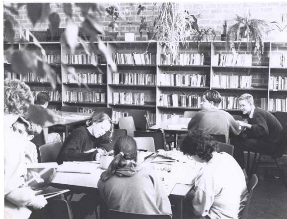
Bibliotheek jaren 80. Nu lokaal 1.57

Leerlingen konden verder gebruik maken van de bibliotheek die naast de keuken was gevestigd. Diverse docenten waren actief betrokken bij het wel en wee van de bibliotheek. Zo werden artikelen uit tijdschriften bijvoorbeeld keurig gecatalogiseerd. Voor de B2 opdrachten die voor het vak Nederlands uitgevoerd moesten worden was de bieb een onmisbare informatiebron.