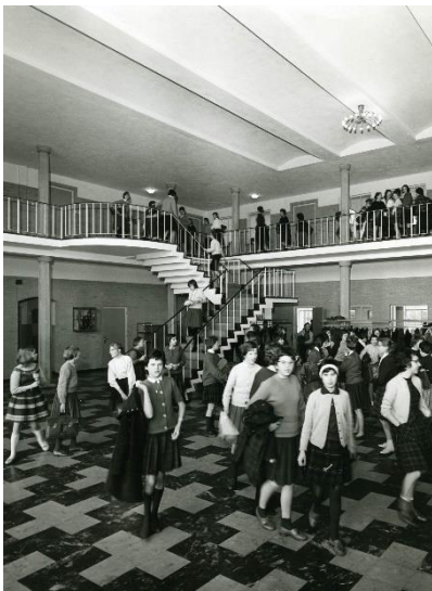
Hal in de jaren 50