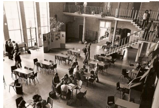
Hal in de jaren 80

De imposante ruimte stond vol met tafels welke voorzien waren van formica tafelbladen. Om de tafel heen stonden stoelen met een ijzeren onderstel en een groen plastic kuipje.