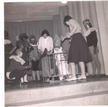
Sinterklaas op het toneel in de hal