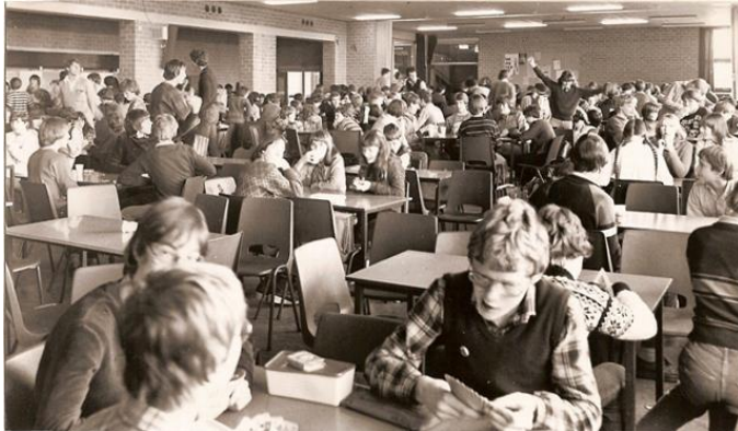
Aula jaren 80. Nu lokalen 1.50 t/m 1.54