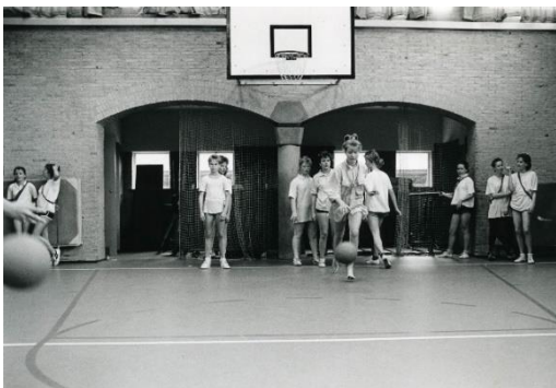
Benedengymzaal, nu OLC