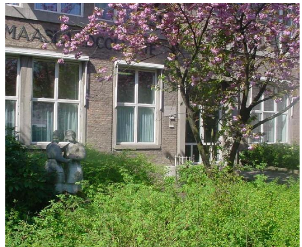
De prunus in de voortuin

Pratend over die hal denk je aan het gebouw. Daar kun je op verschillende manieren naar kijken. Het geheel geeft de indruk van een lappendeken, misschien weinig fraai. Toch kun je het ook waarderen vanuit een historisch perspectief. Het totale complex laat door zijn aanbouwen prachtig zien in welke perioden de school groei heeft meegemaakt en je ziet de veranderingen in de bouwwijze van scholen van de afgelopen 75 jaar mooi terug. Van stevige, karakteristieke architectuur eind jaren vijftig, naar snelle goedkope oplossingen in de jaren zeventig, tot strakke moderne lijnen met verrassende ontwerpkeuzes aan het begin van deze eeuw. Groot voordeel van die variatie is dat het totale complex je snel eigen wordt. Je hebt direct in de gaten waar je precies bent. Dat geldt ook voor de buitenruimte, die verspreid tussen de gebouwen is terug te vinden en op elke plek zijn eigen decor biedt, soms fraai en gezellig, maar soms ook gewoon ongezellig en kil. Dat doet mij eraan herinneren dat ik wat de voortuin betreft voor enige controverses heb gezorgd. In die voortuin stonden stevige prunussen, die elke lente voor fraaie bloesems zorgden, maar de rest van het jaar met hun bladerdek de prachtige voorgevel van de school uit het zicht hield. Wonend in de Betuwe houd ik natuurlijk van bloesem, toch vond ik het beter die korte