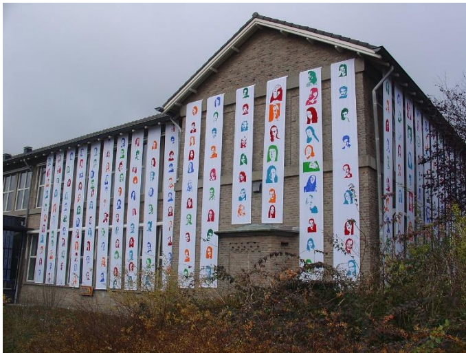
60 jaar Maaslandcollege

In de zomervakantie trok Adriaan samen met de toa's door de school. Om alle tafels en stoelen te repareren die te lijden hadden onder het intensieve gebruik door de leerlingen. Stoeldoppen werden vervangen, tafelbladen weer vastgezet. En nog veel meer.