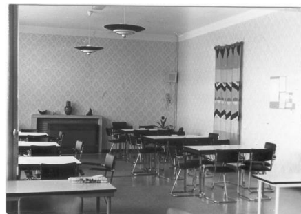
Personeelskamer jaren zeventig 20 e eeuw

De hal als karakteristiek centrum is bekend. Maar is jullie ook bekend dat de personeelskamer tot eind van de 20 e eeuw gehuisvest was in het huidige lokalen 1.13. en 1.14? En dat de huidige personeelskamer tot die tijd piepkleine leslokalen waren?