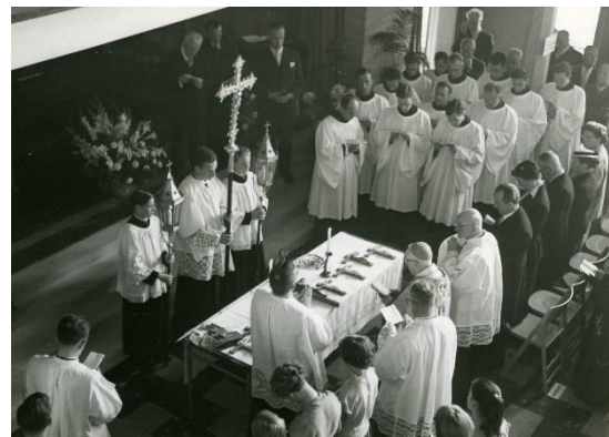
De hal als gebedsruimte...

Op 8 september 1955, het feest van Maria Geboorte, werd het gebouw in gebruik genomen. Plechtig ingezegend door de bisschop van 's-Hertogenbosch, mgr. Mutsaers. In het Dagblad voor Oss en omstreken werd op vrijdag 9 september uitgebreid verslag gedaan van de opening.