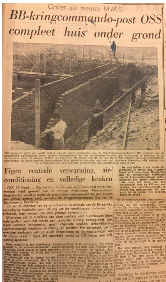
Aandacht voor de bouw van de kelder in de pers.

Allereerst werd de ruimte gebouwd en ingericht voor de Bescherming Bevolking (B.B.). De Bescherming Bevolking is ontstaan ten gevolge van de Koude Oorlog. Op 20 oktober 1950 richtte de minister van Binnenlandse Zaken een "Nota inzake de burgerlijke verdediging" aan de Tweede Kamer. Immers, "de oorlogsvoering heeft een totaal karakter gekregen en eist alle krachten tot het uiterste op". Het gevolg van deze nota was de totstandkoming van de Wet Bescherming Bevolking in 1952. De wet verstond onder Bescherming Bevolking "het geheel van niet-militaire maatregelen ter bescherming van de bevolking en haar bezittingen, zomede de bezittingen van openbare lichamen tegen de onmiddellijke gevolgen van oorlogsgeweld". De organisatie van de B.B. was een landelijke. De B.B. viel onder het ministerie van Binnenlandse Zaken. In de provincies werden de Commissarissen van de Koningin, in de gemeenten de burgemeesters en in de kringen (meerdere gemeenten waren verenigd tot een kring) de Kringraad verantwoordelijk